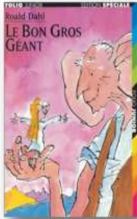
Foliot Junior, 2001, 265 pages (dont 45 avec des jeux)